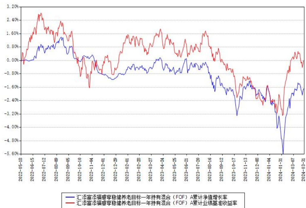
汇添富添福睿享稳健养老目标一年持有混合（FOF）A累计净值增长率与同期业绩基准收益率对比图