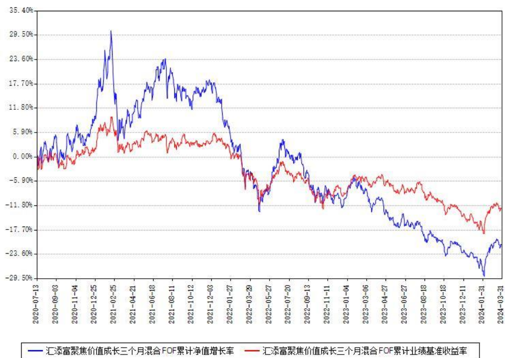
汇添富聚焦价值成长三个月混合FOF累计净值增长率与同期业绩基准收益率对比图