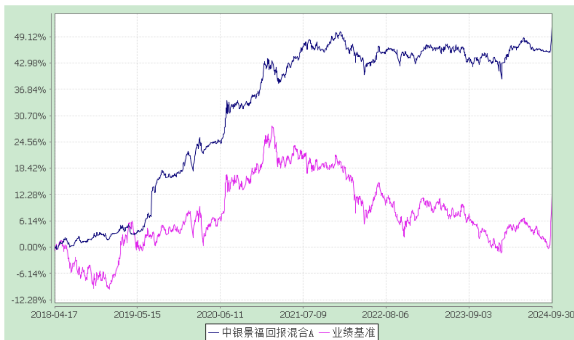
2. 中银景福回报混合 C: