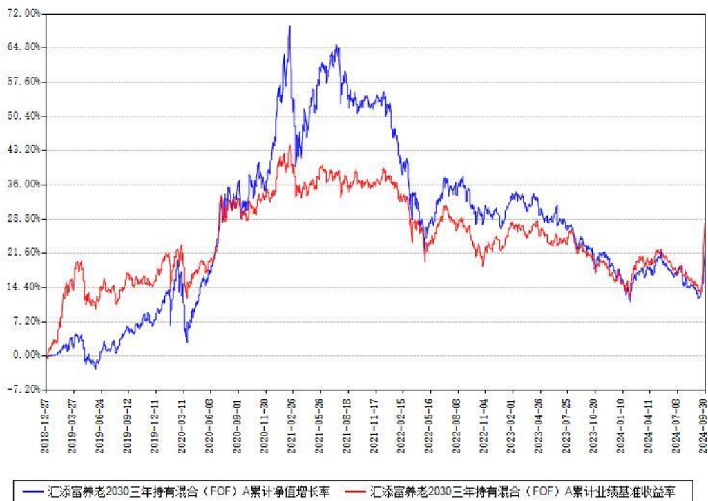
汇添富养老2030三年持有混合（FOF）Y累计净值增长率与同期业绩比较基准收益率对比图