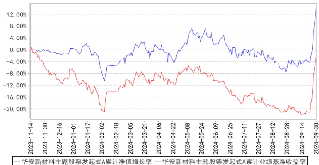
华安新材料主题股票发起式A累计净值增长率与同期业绩比较基准收益率的历史走势对比图