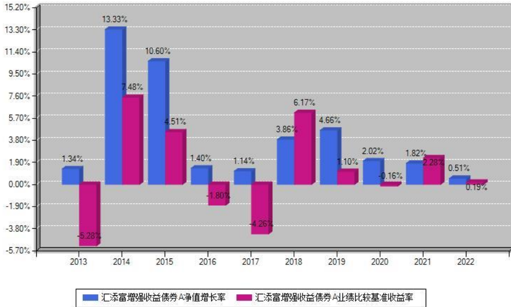
汇添富增强收益债券A每年净值增长率与同期业绩基准收益率对比图

注：数据截止日期为2022年12月31日，基金的过往业绩不代表未来表现。本《基金合同》生效之日为2008年03月06日，合同生效当年按实际存续期计算，不按整个自然年度进行折算。