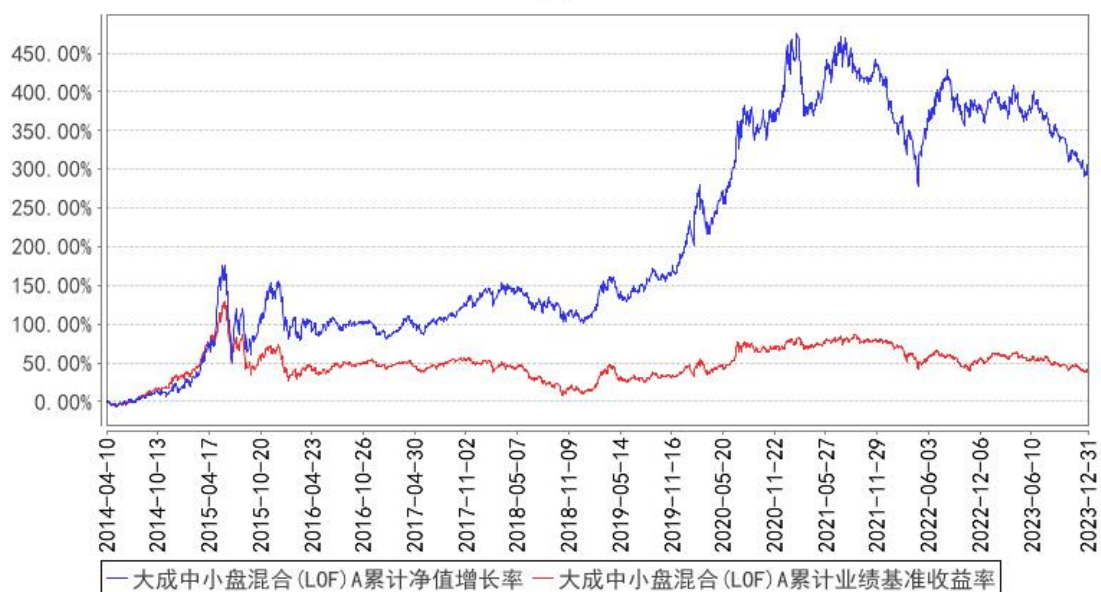
大成中小盘混合(LOF)A累计净值增长率与同期业绩比较基准收益率的历史走势对比图

(二) 自基金合同生效以来基金份额累计净值增长率变动及其与同期业绩比较基准收益率变动的比较