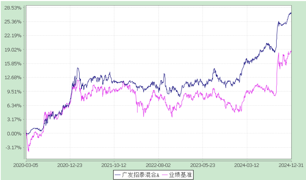
广发招泰混合型证券投资基金 累计净值增长率与业绩比较基准收益率的历史走势对比图 (2020 年 3 月 5 日至 2024 年 12 月 31 日)