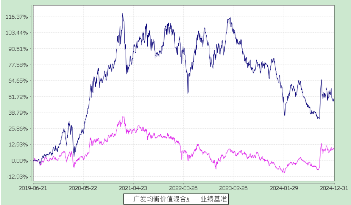
广发均衡价值混合型证券投资基金 累计净值增长率与业绩比较基准收益率的历史走势对比图 (2019 年 6 月 21 日至 2024 年 12 月 31 日)