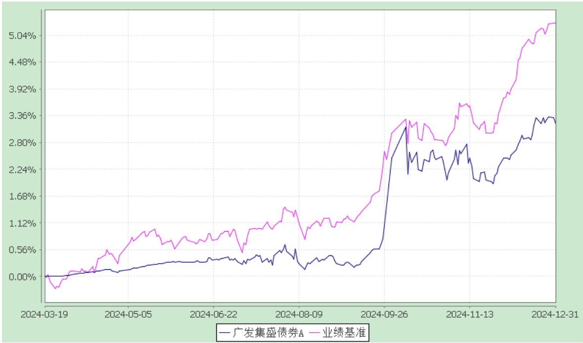
广发集盛债券型证券投资基金 累计净值增长率与业绩比较基准收益率的历史走势对比图 (2024 年 3 月 19 日至 2024 年 12 月 31 日)