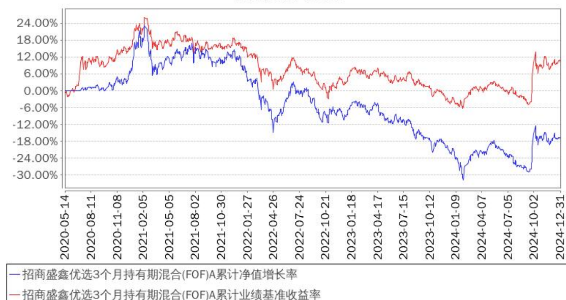
招商盛鑫优选3个月持有期混合(FOF)A累计净值增长率与同期业绩比较基准收益率的历史走势对比图