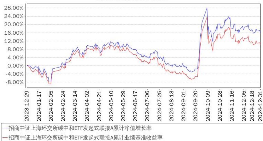
招商中证上海环交所碳中和ETF发起式联接A累计净值增长率与同期业绩比较基准收益率的历史走势对比图