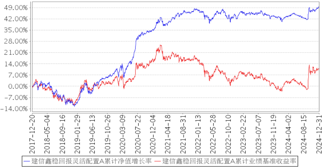
建信鑫稳回报灵活配置A累计净值增长率与同期业绩比较基准收益率的历史走势对比图