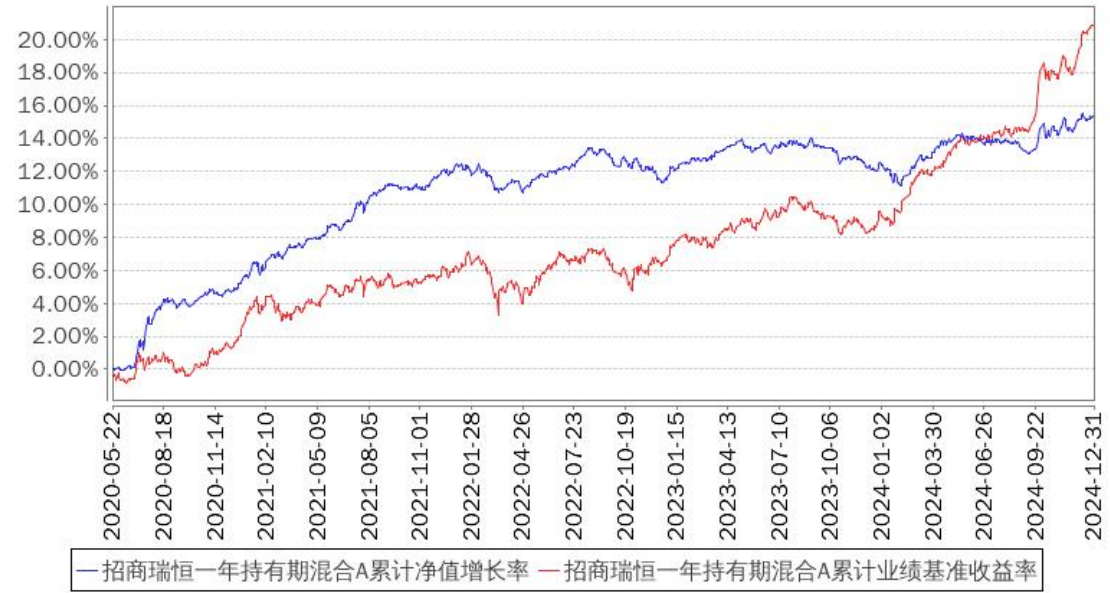
招商瑞恒一年持有期混合A累计净值增长率与同期业绩比较基准收益率的历史走势对比图