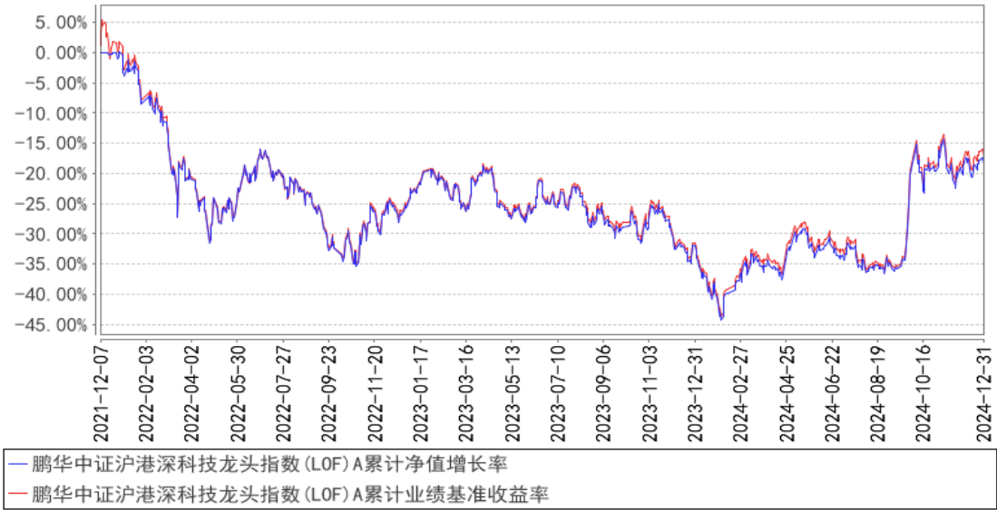
鹏华中证沪港深科技龙头指数 (LOF) A 累计净值增长率与同期业绩比较基准收益率的历史走势对比图

鹏华中证沪港深科技龙头指数（LOF）I 基金份额的首次确认日为 2024 年 12 月 30 日。