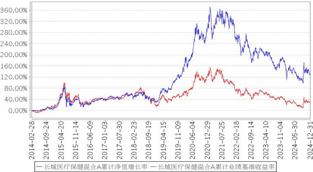
长城医疗保健混合A累计净值增长率与同期业绩比较基准收益率的历史走势对比图