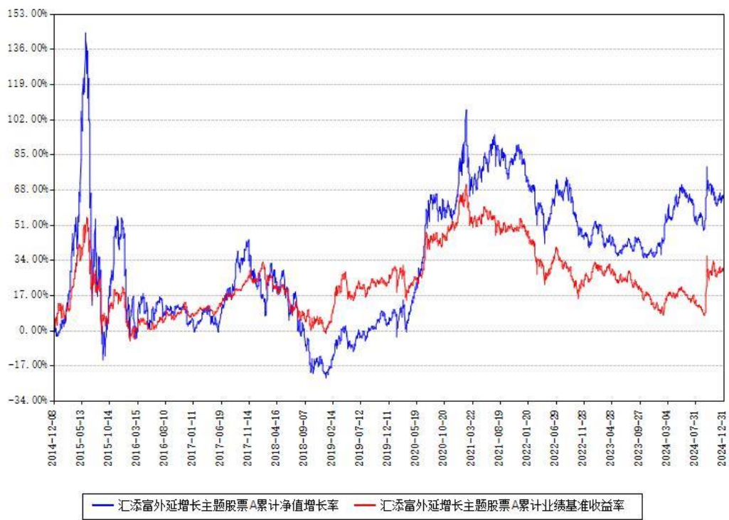
汇添富外延增长主题股票A累计净值增长率与同期业绩基准收益率对比图