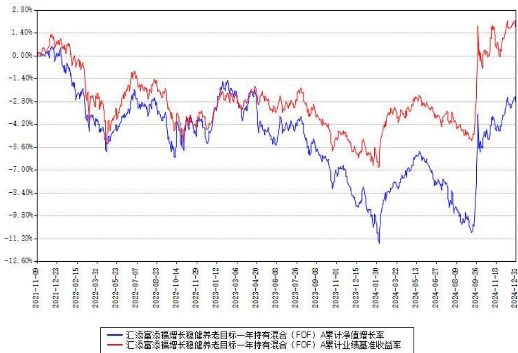
汇添富添福增长稳健养老目标一年持有混合（FOF）Y 累计净值增长率与同期业绩比较基准收益率对比图