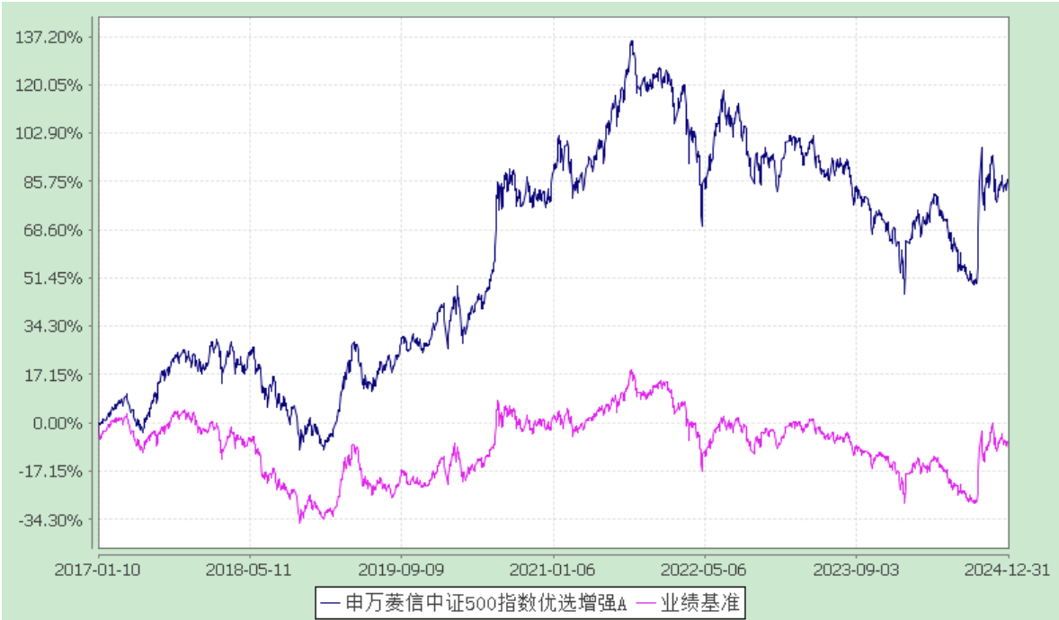
申万菱信中证 500 指数优选增强型证券投资基金 累计净值增长率与业绩比较基准收益率的历史走势对比图 (2017 年 1 月 10 日至 2024 年 12 月 31 日)

注：申万菱信中证500指数优选增强型证券投资基金基金Y类份额合同生效日为2024年12月13日。