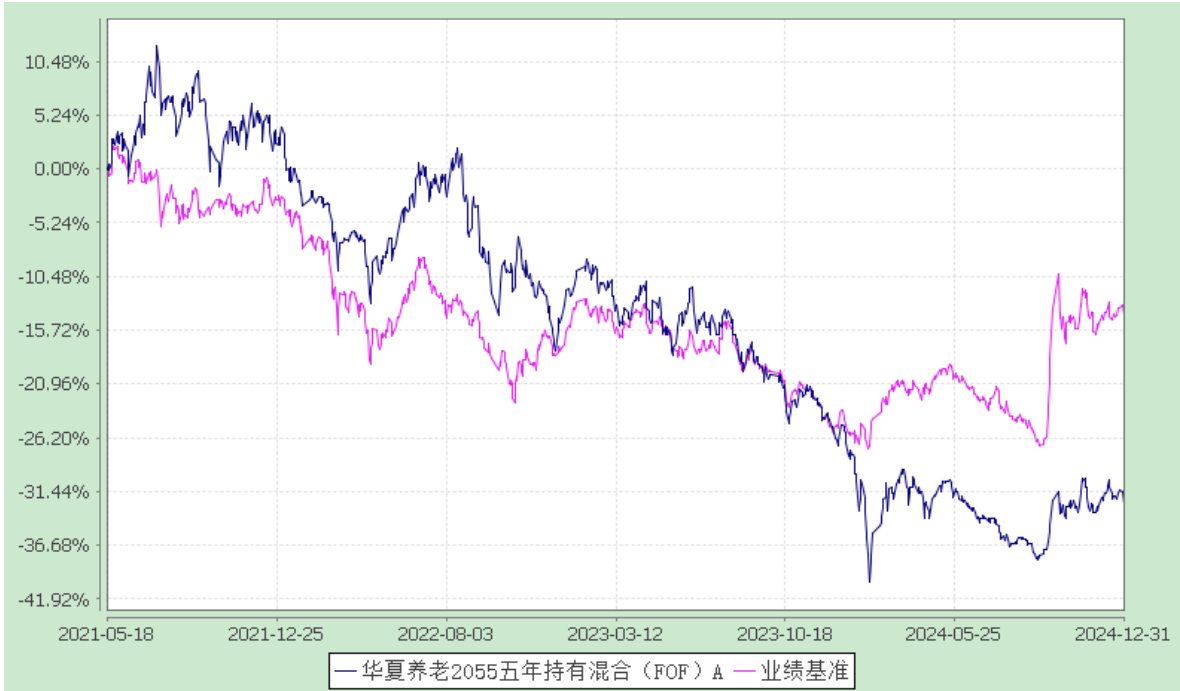
华夏养老 2055 五年持有混合（FOF）Y：