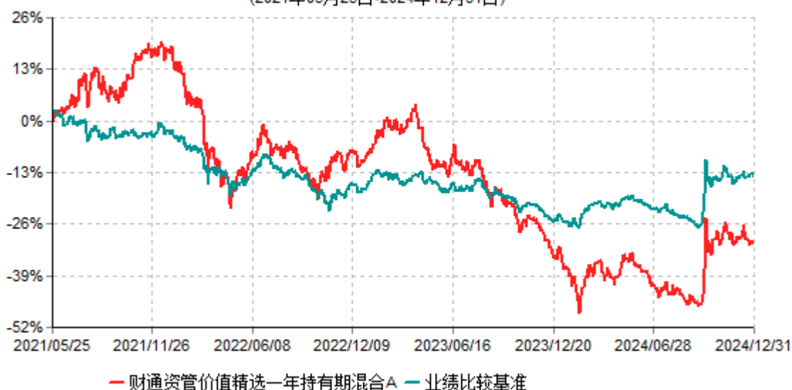
财通资管价值精选一年持有期混合A累计净值增长率与业绩比较基准收益率历史走势对比图 (2021年05月25日-2024年12月31日)