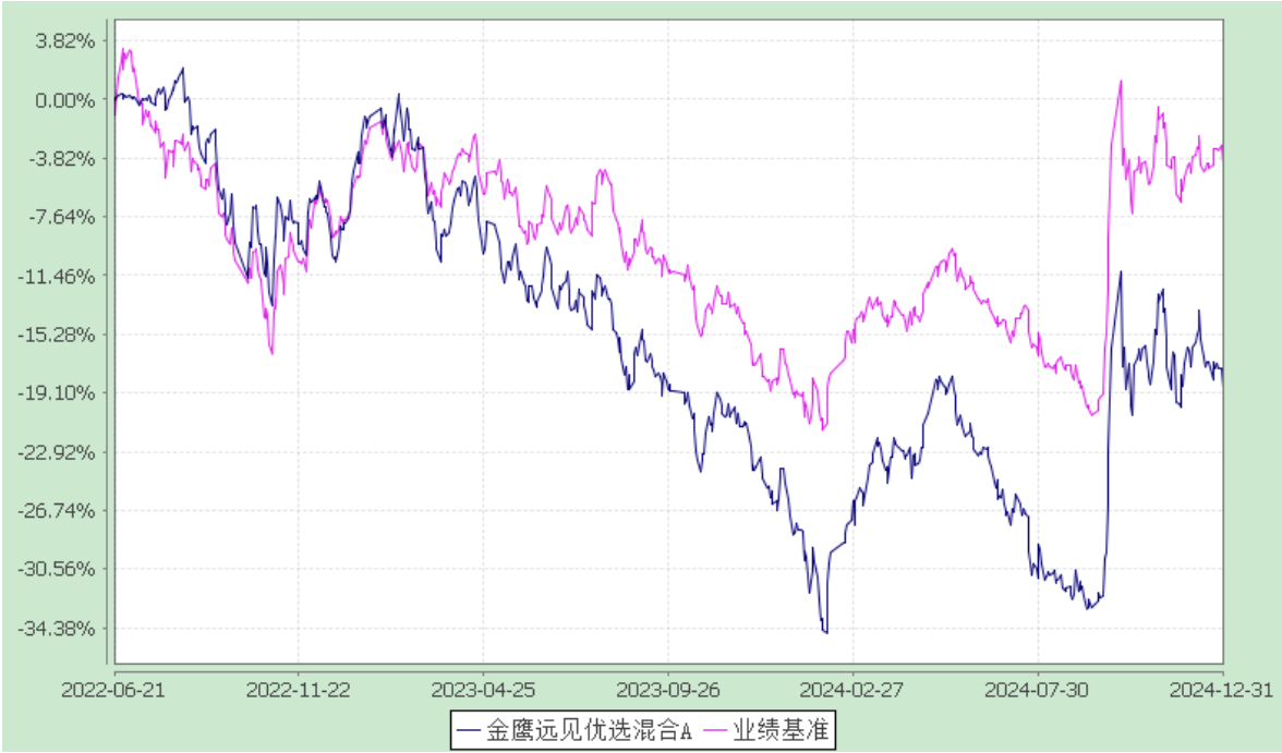
金鹰远见优选混合型证券投资基金 累计净值增长率与业绩比较基准收益率的历史走势对比图 (2022 年 6 月 21 日至 2024 年 12 月 31 日)