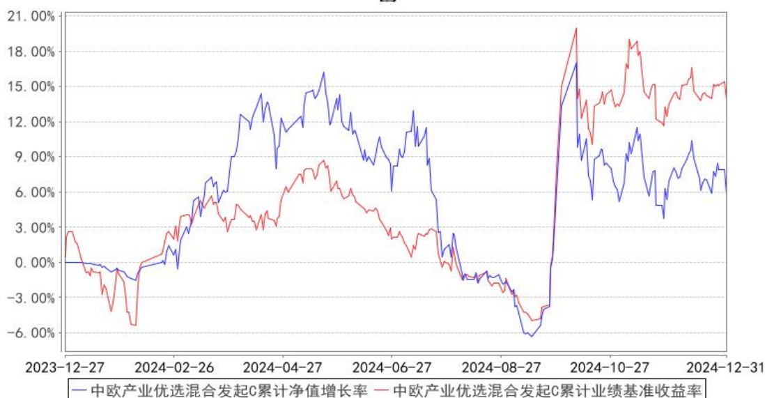
中欧产业优选混合发起C累计净值增长率与同期业绩比较基准收益率的历史走势对比图

注：本基金基金合同生效日期为 2023 年 12 月 27 日，按基金合同的规定，本基金自基金合同生效起六个月为建仓期，建仓期结束时各项资产配置比例已经符合基金合同约定。