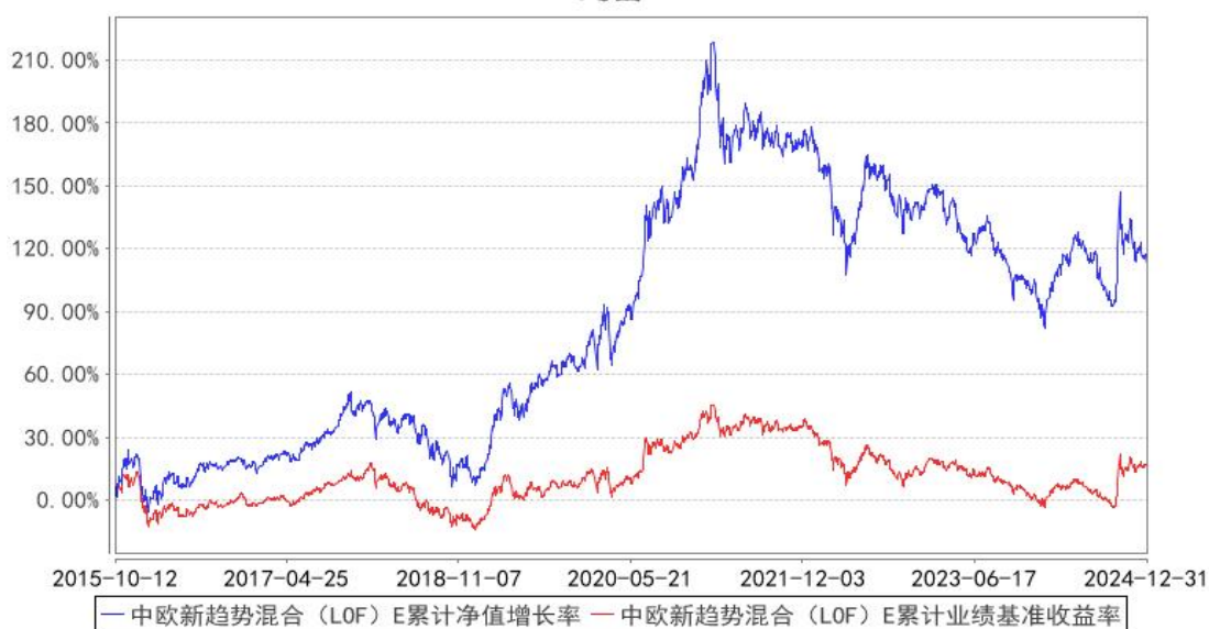
中欧新趋势混合（LOF）E 累计净值增长率与同期业绩比较基准收益率的历史走势对比图

注：本基金于 2015 年 10 月 8 日新增 E 类份额，图示日期为 2015 年 10 月 12 日至 2024 年 12 月 31 日。