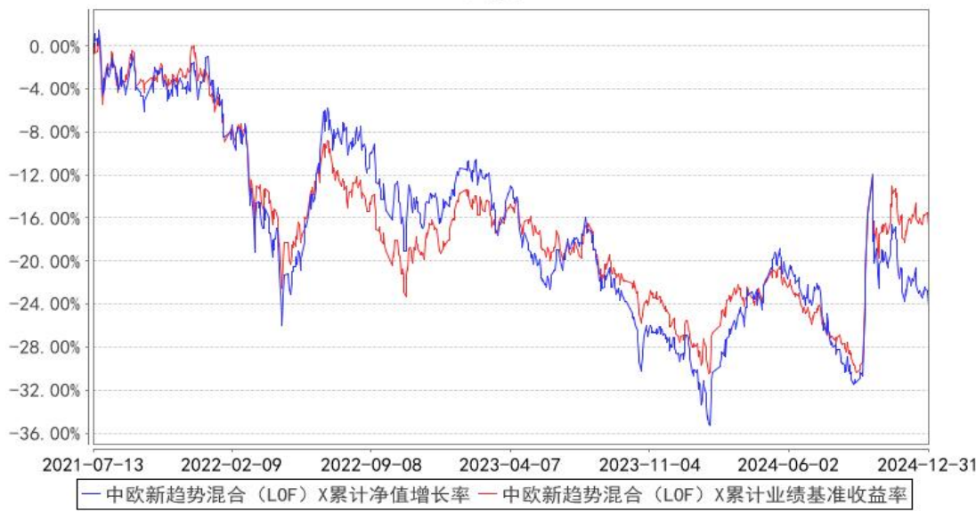
中欧新趋势混合（LOF）X 累计净值增长率与同期业绩比较基准收益率的历史走势对比图

注：本基金于 2021 年 7 月 12 日新增 X 类份额，图示日期为 2021 年 7 月 13 日至 2024 年 12 月 31 日。