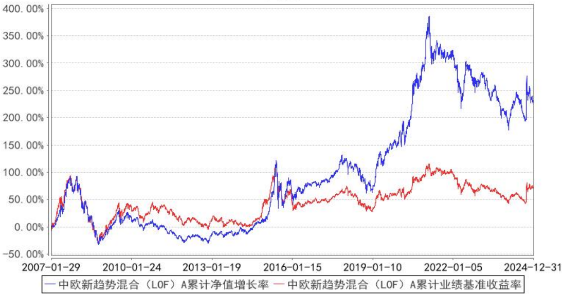
中欧新趋势混合（LOF）A 累计净值增长率与同期业绩比较基准收益率的历史走势对比图