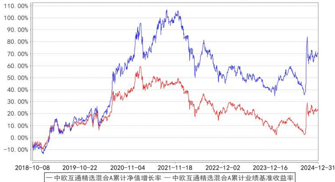
中欧互通精选混合A累计净值增长率与同期业绩比较基准收益率的历史走势对比图

注：自 2018 年 10 月 8 日起，原中欧沪深 300 指数增强型证券投资基金转型为中欧互通精选混合型证券投资基金。图示为 2018 年 10 月 8 日至 2024 年 12 月 31 日。