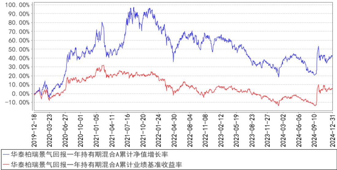
华泰柏瑞景气回报一年持有期混合A累计净值增长率与同期业绩比较基准收益率的历史走势对比图