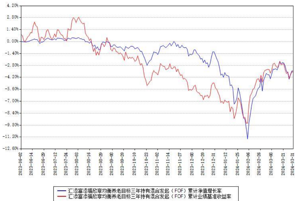
汇添富添福欣享均衡养老目标三年持有混合发起（FOF）累计净值增长率与同期业绩基准收益率对比图