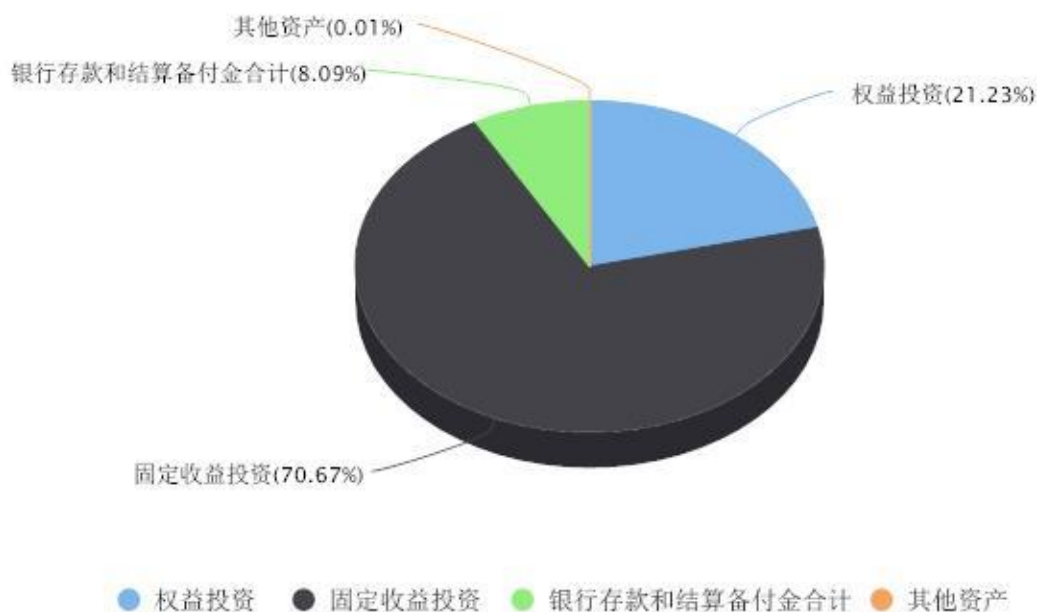
投资组合资产配置图表 数据截止日期:2024年12月31日