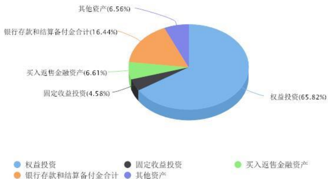
投资组合资产配置图表 数据截止日期:2024年12月31日