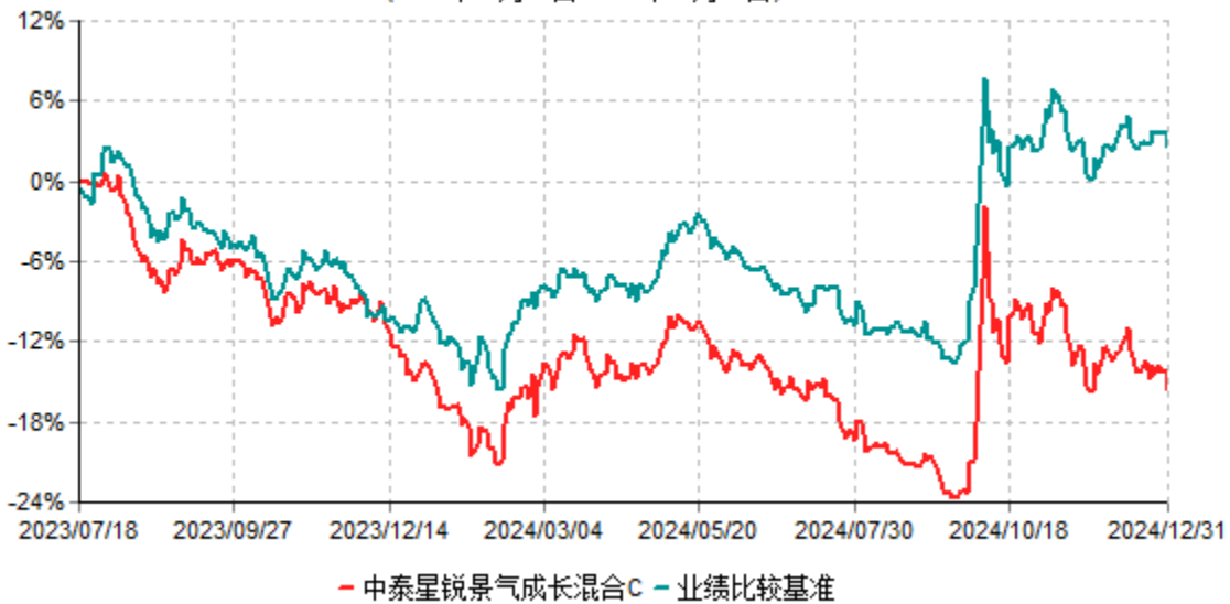
中泰星锐景气成长混合C累计净值增长率与业绩比较基准收益率历史走势对比图 (2023年07月18日-2024年12月31日)

注：根据基金合同约定，本基金自基金合同生效之日起6个月内为建仓期。建仓期结束时，本基金各项资产配置比例符合基金合同约定。