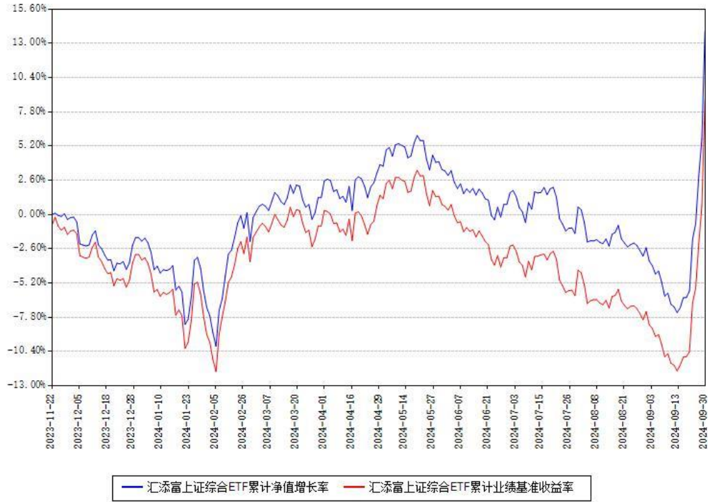
汇添富上证综合ETF累计净值增长率与同期业绩基准收益率对比图