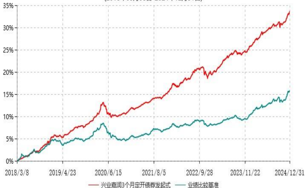
兴业嘉润3个月定期开放债券型发起式证券投资基金累计净值增长率与业绩比较基准收益率历史走势对比图 (2018年03月08日-2024年12月31日)