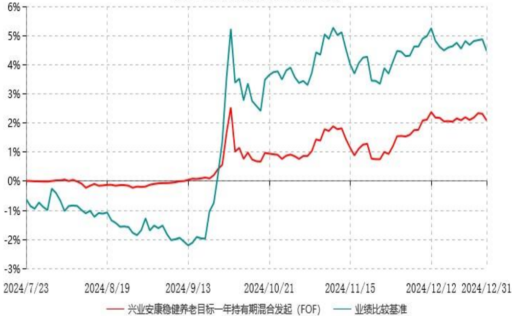
兴业安康稳健养老目标一年持有期混合型发起式基金中基金（FOF）累计净值增长率与业绩比较基准收益率历史走势对比图 (2024年07月23日-2024年12月31日)

本基金的业绩比较基准为：中证普通债券型基金指数收益率*70%+中证股票型基金指数收益率*25%+银行活期存款利率(税后)*5%