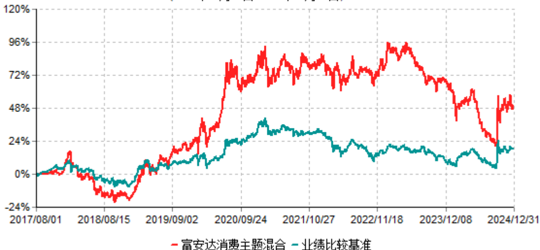
富安达消费主题灵活配置混合型证券投资基金累计净值增长率与业绩比较基准收益率历史走势对比图 (2017年08月01日-2024年12月31日)

注：本基金原业绩比较基准为：沪深300指数收益率*60%+中债总指数收益率*40%，修订后的业绩比较基准为：中证内地消费主题指数收益率*60%+中债总指数收益率*40%，修改后的业绩比较基准生效日为2023年7月25日。