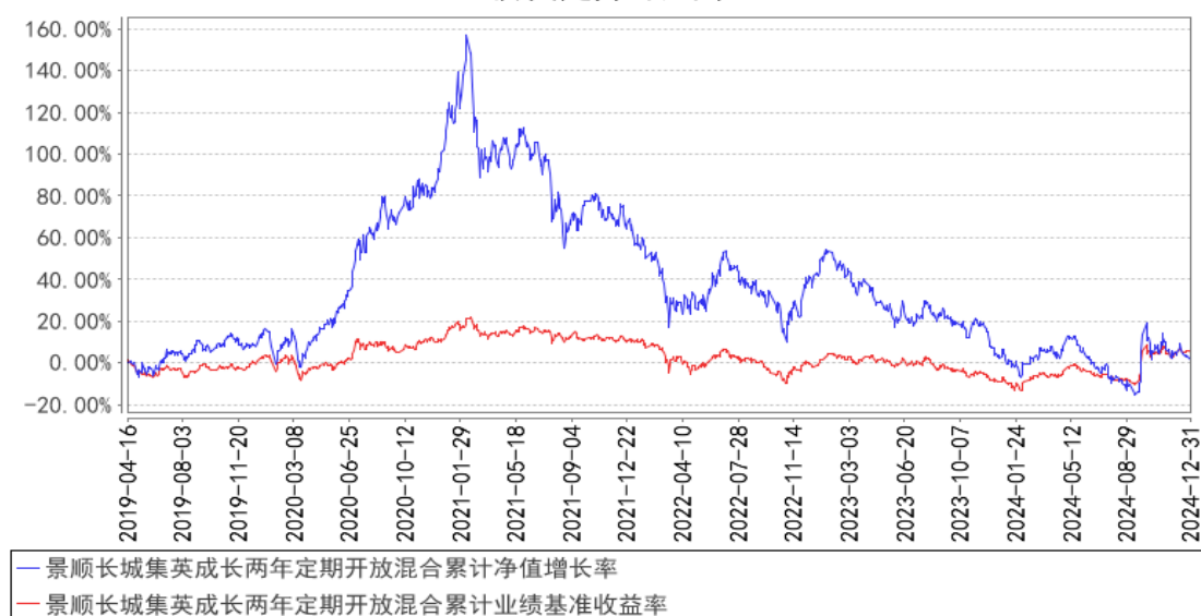
景顺长城集英成长两年定期开放混合累计净值增长率与同期业绩比较基准收益率的历史走势对比图

注：基金的投资组合比例为：开放期内，本基金股票投资占基金资产的比例范围为 50%—95%；封闭期内，本基金股票投资占基金资产的比例范围为 50%—100%。在开放期和封闭期内，本基金港股通标的股票最高投资比例不得超过股票资产的 50%。开放期内，本基金每个交易日日终在扣除股指期货合约需缴纳的交易保证金后，应当保持不低于基金资产净值 5%的现金或者到期日在一年以内的政府债券；在封闭期内，本基金不受上述 5%的限制，但在扣除股指期货合约需缴纳的交易保证金后，应当保持不低于交易保证金一倍的现金。其中现金不包括结算备付金、存出保证金、应收申购款等。本基金的建仓期为自 2019 年 4 月 16 日基金合同生效日起 6 个月。建仓期结束时，本基金投资组合达到上述投资组合比例的要求。