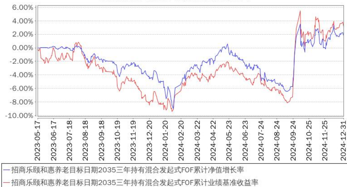
招商乐颐 and 惠养老目标日期 2035 三年持有混合发起式 FOF 累计净值增长率与同期业绩比较基准收益率的历史走势对比图