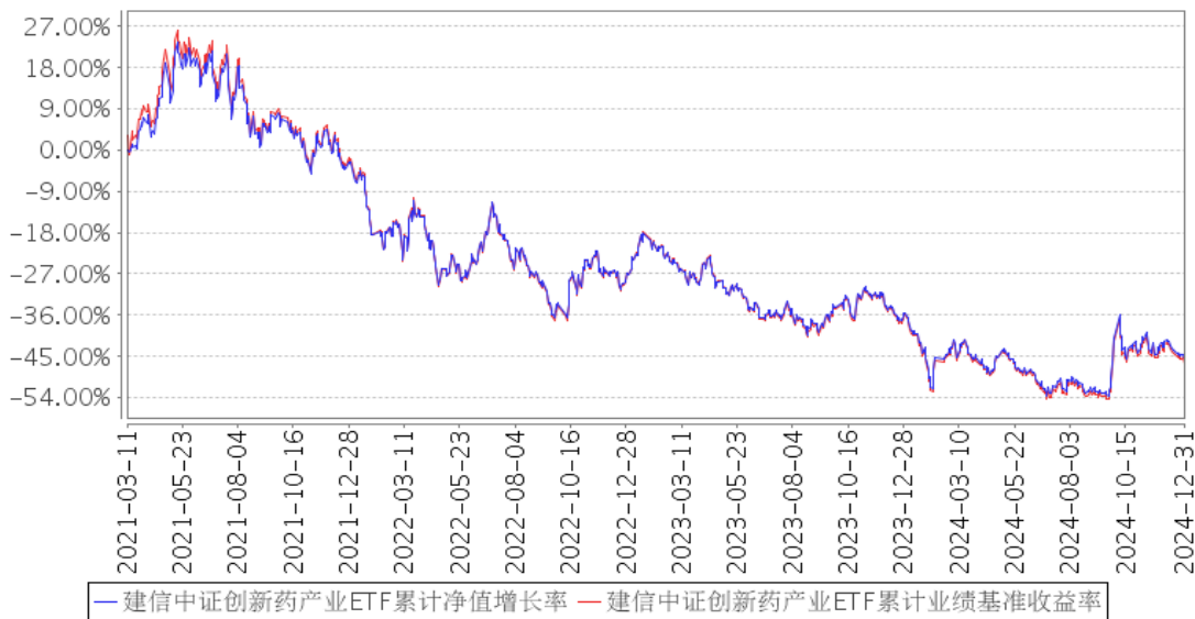
建信中证创新药产业ETF累计净值增长率与同期业绩比较基准收益率的历史走势对比图