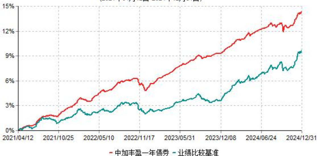
中加丰盈一年债券累计净值增长率与业绩比较基准收益率历史走势对比图 (2021年04月12日-2024年12月31日)