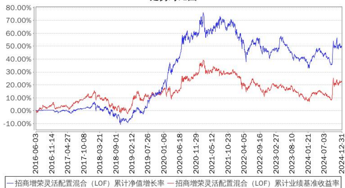
招商增荣灵活配置混合（LOF）累计净值增长率与同期业绩比较基准收益率的历史走势对比图