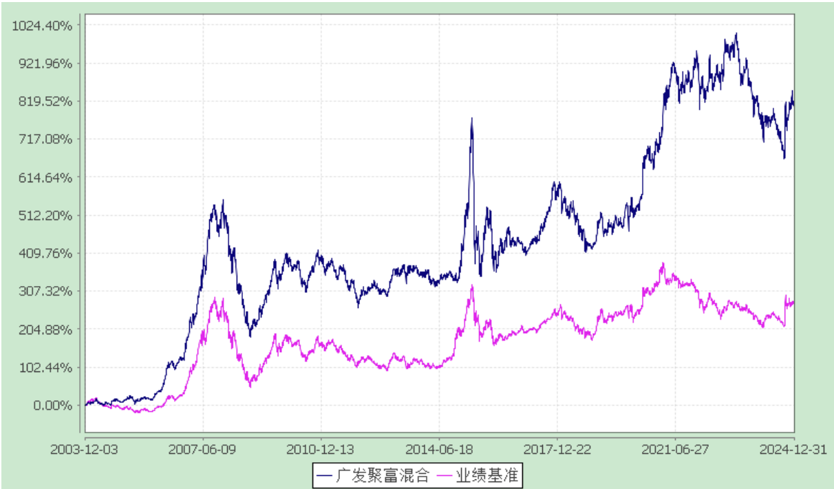
广发聚富开放式证券投资基金 份额累计净值增长率与业绩比较基准收益率的历史走势对比图 (2003 年 12 月 3 日至 2024 年 12 月 31 日)

注：自 2015 年 11 月 2 日起，本基金的业绩比较基准由“中信标普 300 指数收益率×80%+中信标普全债指数收益率×20%”变更为“沪深 300 指数收益率×80%+中证全债指数收益率×20%”。