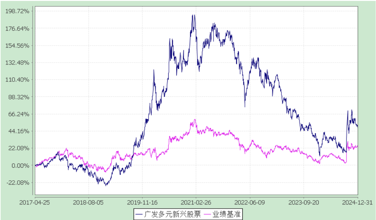
份额累计净值增长率与业绩比较基准收益率的历史走势对比图 (2017 年 4 月 25 日至 2024 年 12 月 31 日)