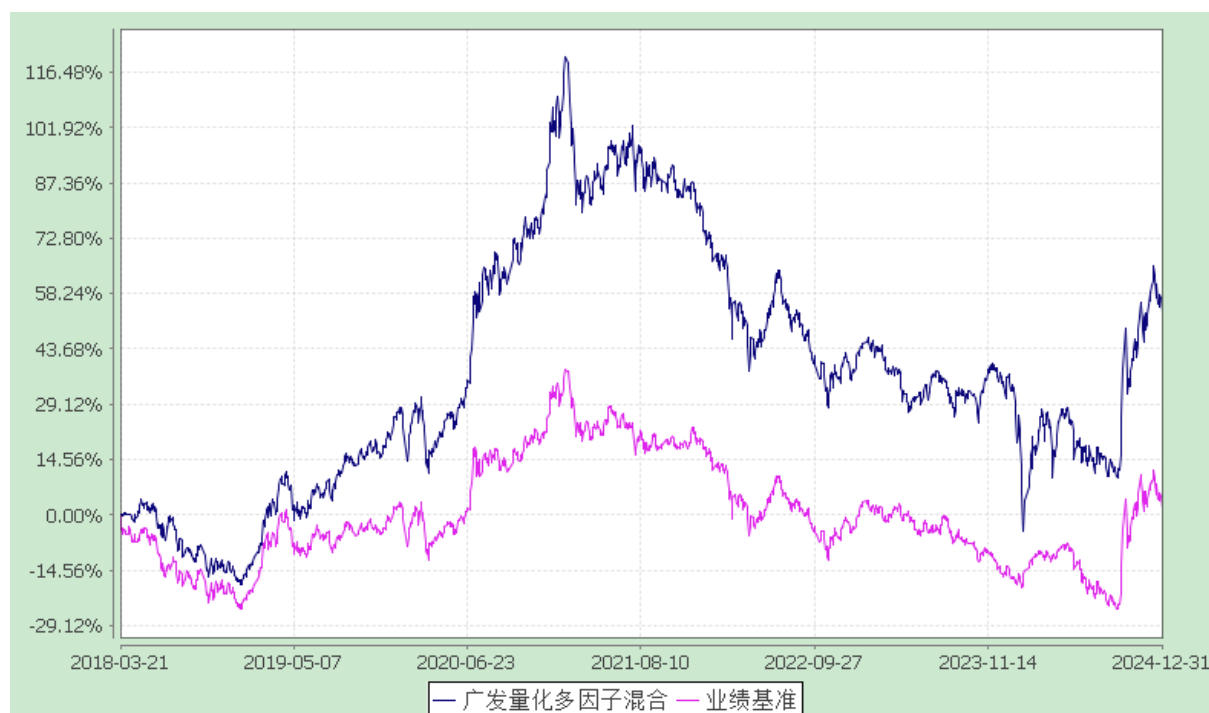
广发量化多因子灵活配置混合型证券投资基金 份额累计净值增长率与业绩比较基准收益率的历史走势对比图 (2018 年 3 月 21 日至 2024 年 12 月 31 日)

注：自 2024 年 5 月 29 日起，本基金的业绩比较基准由“沪深 300 指数收益率×90%+银行活期存款利率(税后)×10%”变更为“国证 2000 指数收益率×95%+银行活期存款利率(税后)×5%”。