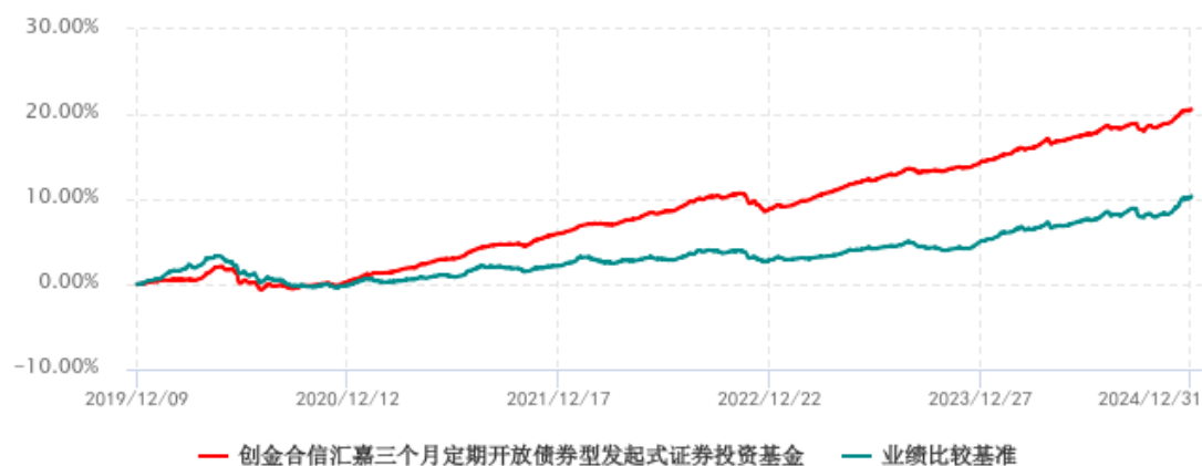
创金合信汇嘉三个月定期开放债券型发起式证券投资基金累计净值增长率与业绩比较基准收益率历史走势对比图 (2019年12月09日-2024年12月31日)