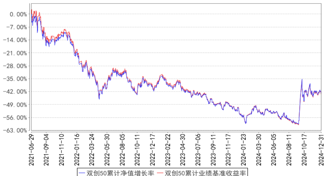
双创50累计净值增长率与同期业绩比较基准收益率的历史走势对比图

注：按基金合同的规定，本基金自基金合同生效起六个月内为建仓期，建仓期结束时本基金的各项投资比例已达到基金合同的规定：本基金投资于标的指数成份股及备选成份股的资产比例不低于基金资产净值的90%，且不低于非现金基金资产的80%，每个交易日日终在扣除股指期货合约、股票期权合约需缴纳的交易保证金后，应当保持不低于交易保证金一倍的现金，其中，现金不包括结算备付金、存出保证金和应收申购款等，因法律法规的规定而受限制的情形除外。