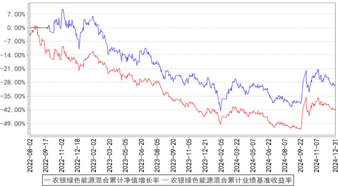
农银绿色能源混合累计净值增长率与同期业绩比较基准收益率的历史走势对比图

注：基金的投资组合比例为：股票资产占基金资产的比例为 60%-95%，投资于本基金界定的“绿色能源”主题相关股票的比例不低于非现金基金资产的 80%。本基金每个交易日日终在扣除股指期货