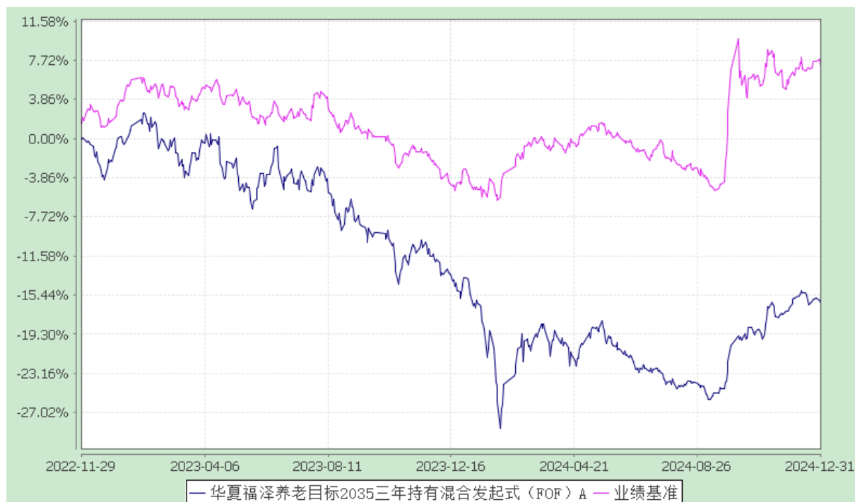
华夏福泽养老目标 2035 三年持有混合发起式（FOF）Y