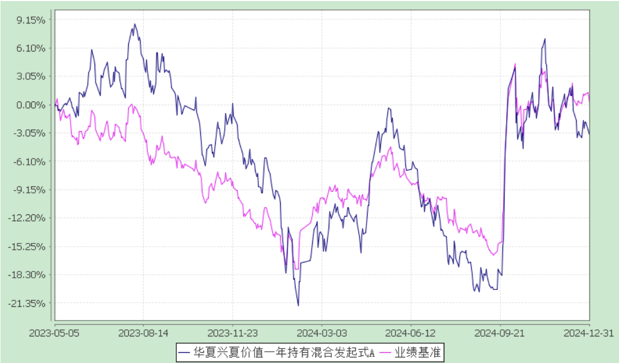
华夏兴夏价值一年持有期混合型发起式证券投资基金 份额累计净值增长率与业绩比较基准收益率历史走势对比图 (2023 年 5 月 5 日至 2024 年 12 月 31 日)

3.2.2 自基金合同生效以来基金份额累计净值增长率变动及其与同期业绩比较基准收益率变动的比较