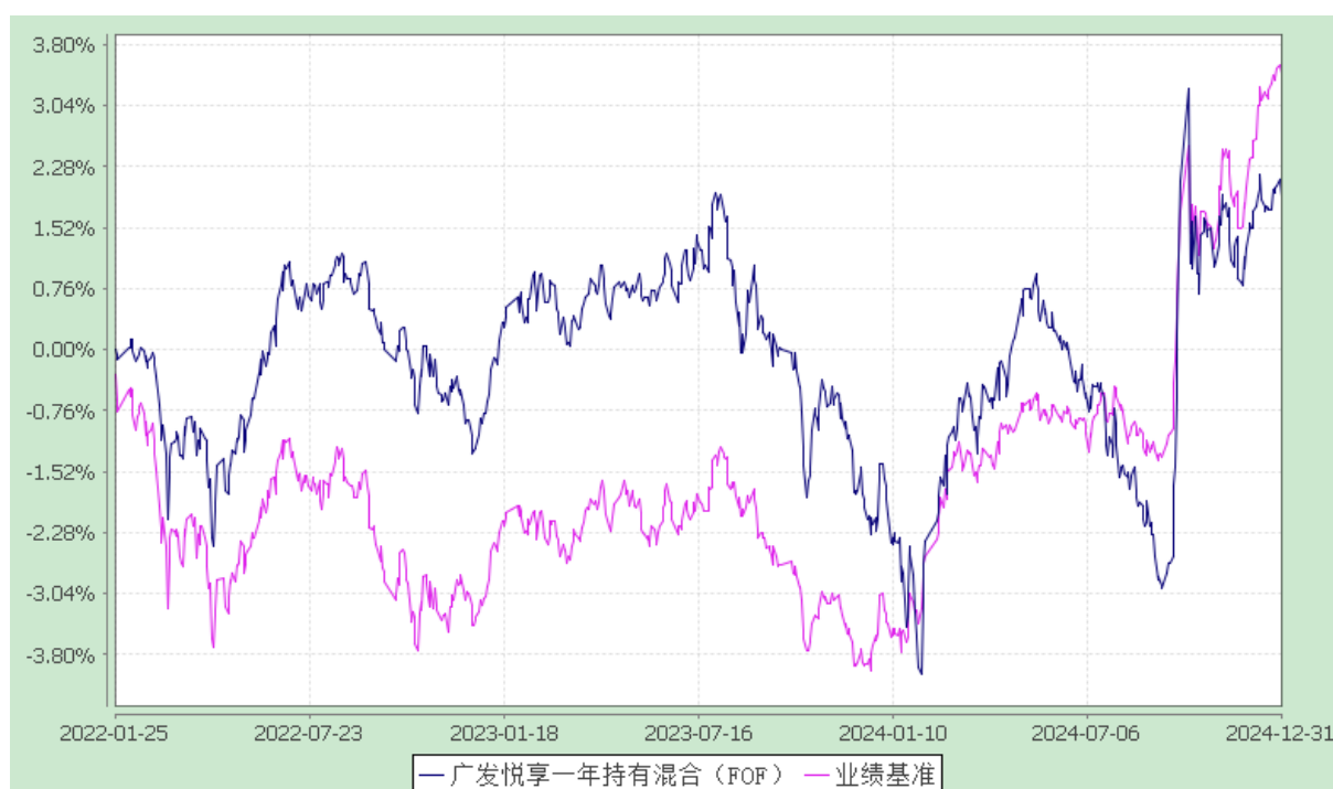
份额累计净值增长率与业绩比较基准收益率历史走势对比图 (2022年1月25日至2024年12月31日)