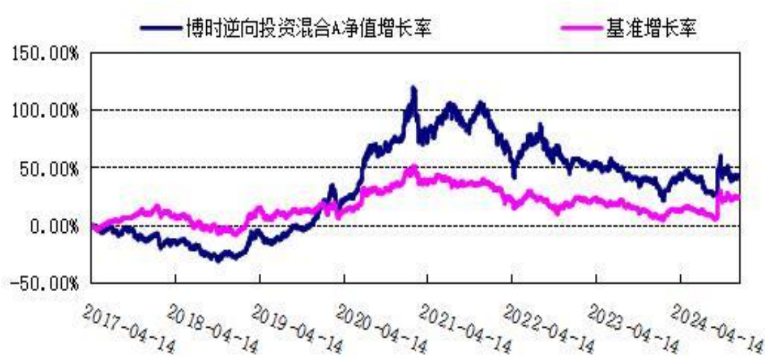
自基金合同生效以来份额累计净值增长率与业绩比较基准收益率的历史走势对比图 (2017 年 4 月 14 日至 2024 年 12 月 31 日)