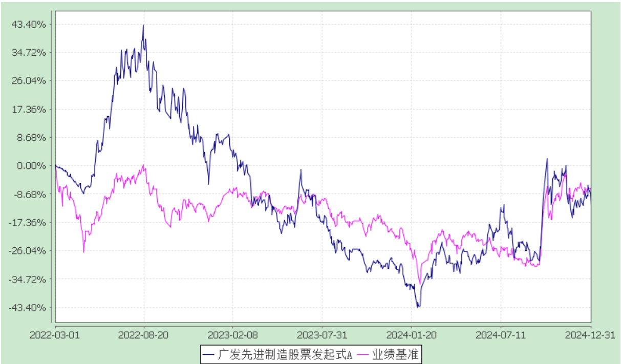
份额累计净值增长率与业绩比较基准收益率的历史走势对比图 (2022 年 3 月 1 日至 2024 年 12 月 31 日)